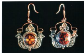
SAFRÁNY NÓRA REKESZZOMÁNC FÜLGÖB (VOROSRÉZ, ARANYOZVA)